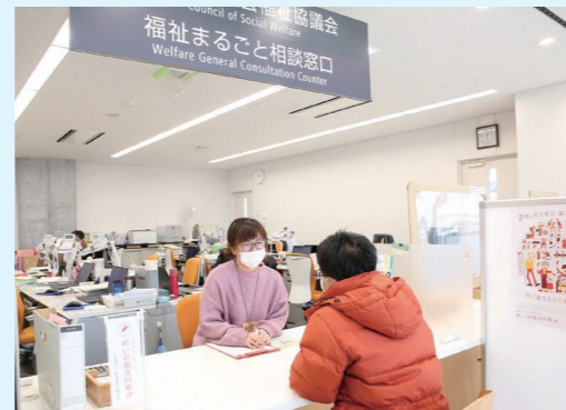
市社会福祉協議会 ☎(94)7091