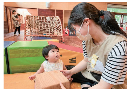
高校生による福祉施設でのショートボランティア活動