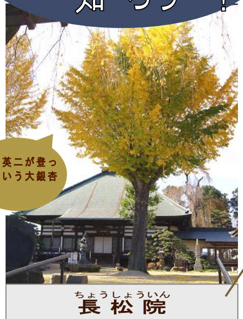
円谷英二が登ったという大銀杏の木