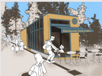
公園内のオープンカフェ 参考：隅田公園