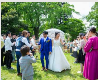
本公園社会実験 (ガーデン・ウェディング)