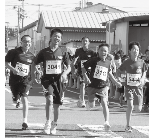
第2の円谷選手を目指して