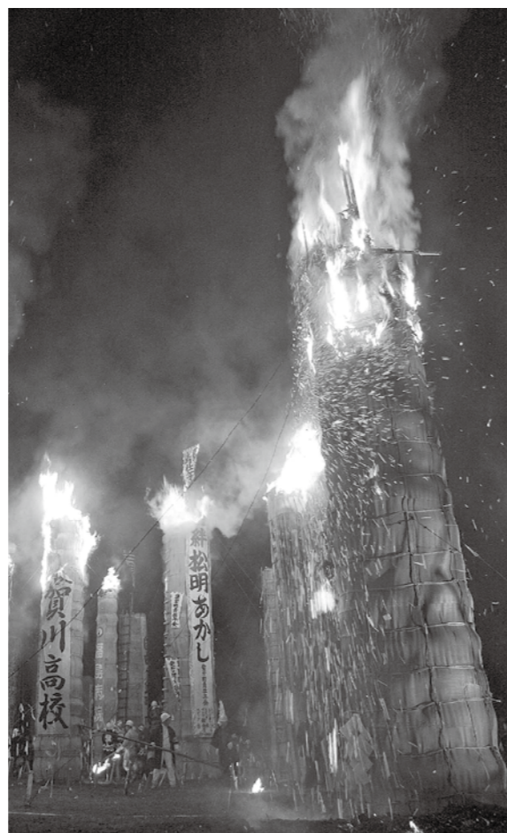
激しく燃え上がる大松明をご覧ください