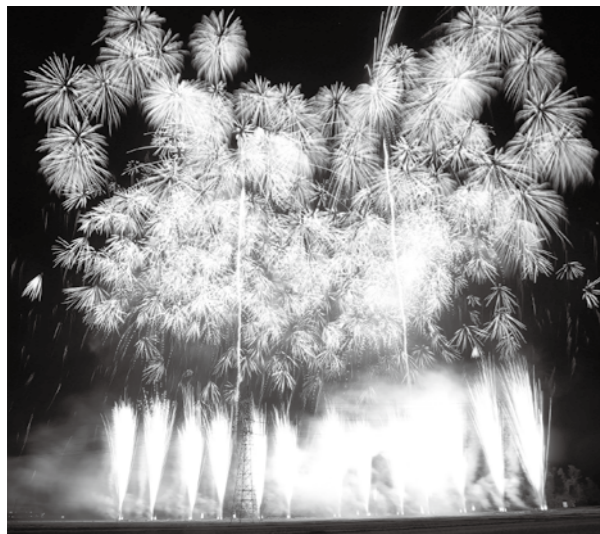
見応えある花火がクライマックスを飾ります