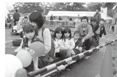
楽しいキッズコーナーもあります