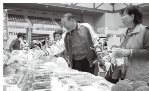
新鮮な野菜や地元特産品の販売なども好評です!

会場 須賀川アリーナと周辺駐車場 主催 すかがわ産業フェスティバル実行委員会 (須賀川市、夢みなみ農業協同組合、須賀川商工会議所)