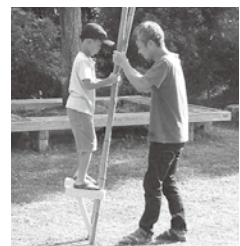
昔の竹馬遊び体験も