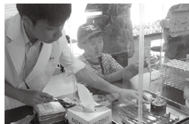
バーナーを使って滅菌処理をします

時8月25日(日) 午前10時~午後4時 須賀川にゆかりのある企業・団体・高校の皆さんによる楽しい科学や工作のお祭りを開催します。 当日はおいしい屋台もたくさん出ます! ※一部先着順で整理券が必要なプログラムもあります。 詳しくはホームページをご覧ください。