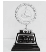
金婚夫婦に贈られる「おしどり金メダル」