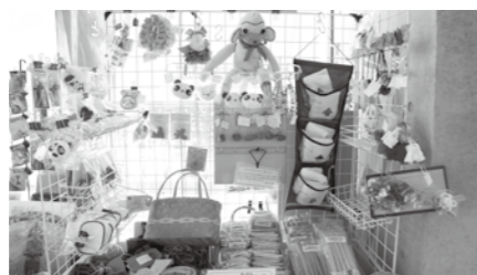
就労継続支援B型事業所がチームを作り、商品開発・製造販売・共同受注を行っています。(市役所1階の売店)