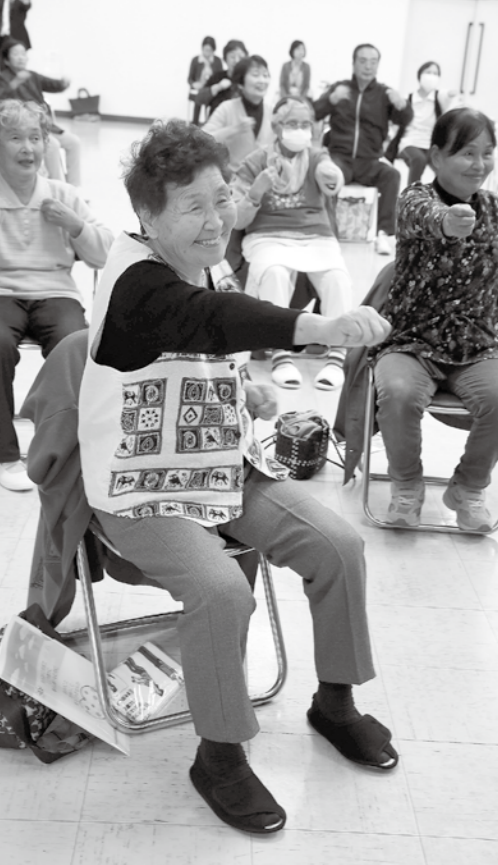
年金の備えで元気な毎日を