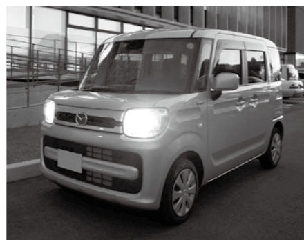
早めの点灯で思いやりのある運転を

12月10日(月)から平成31年1月7日(月)まで、年末年始の交通事故防止県民総ぐるみ運動が県内一斉に展開されます。