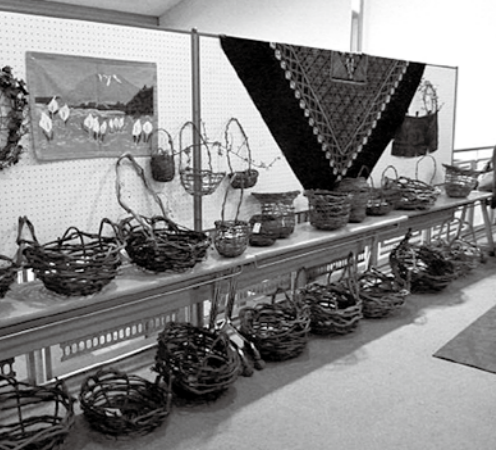
アケビつるで作った作品が並びます

アケビつる・びん・皮細工 作品展と体験教室 オリジナル作品作りも体験できる、アケビつるとびん・皮細工の展示会です。 日時 12月1日(土)～9日(日) 午前10時～午後3時 ※体験教室は午前10時、午後1時(申込制、有料) 会場 福島空港ターミナルビル3階特設会場 アケビつる工房 ☎024(955)2497