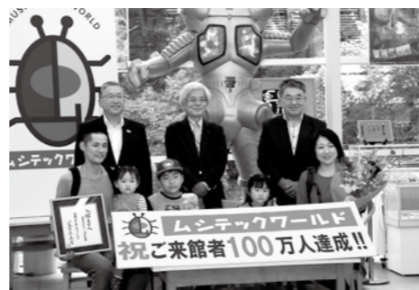
平成13年の開館以来、来館者が100万人を超えました!(9月29日)

ムシテックワールド ☎(89)1120 開館時間:午前9時 閉館時間:午後4時30分