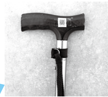
つえの柄の部分にQRコード(小)を貼付した例