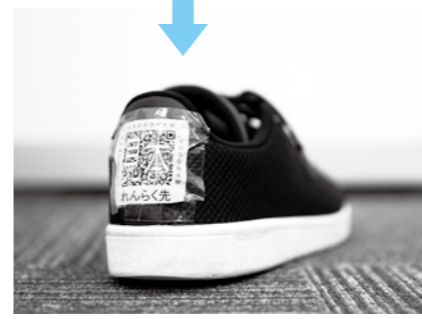
靴のかかと部分にQRコード(大)を貼付した例