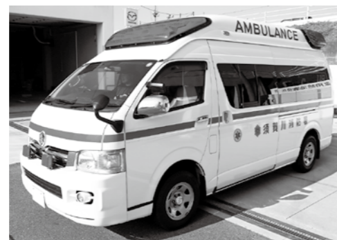
すぐに出勤できる準備を整えています