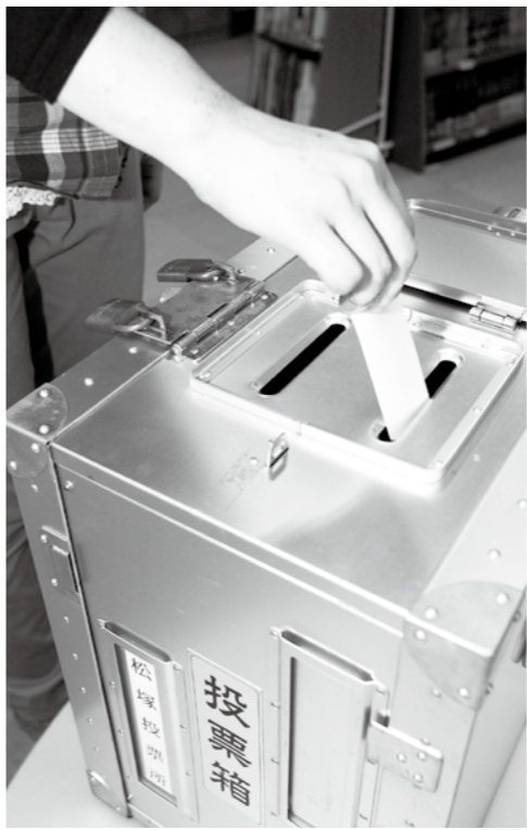
みなさんの大切な一票を忘れずに投票しましょう！