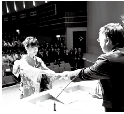
今年の成人証書の代表受領