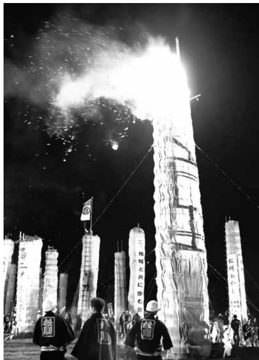
激しく燃え上がる大松明をご覧ください