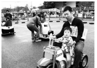
楽しいキッズコーナーもあります