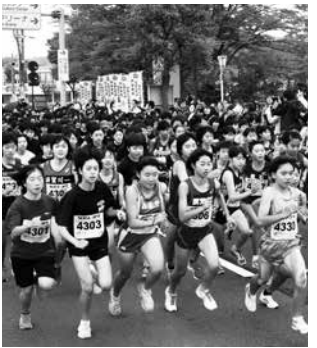
第2の円谷選手を目指して