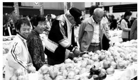
新鮮な野菜、果物、地元特産品の販売など盛りだくさん!