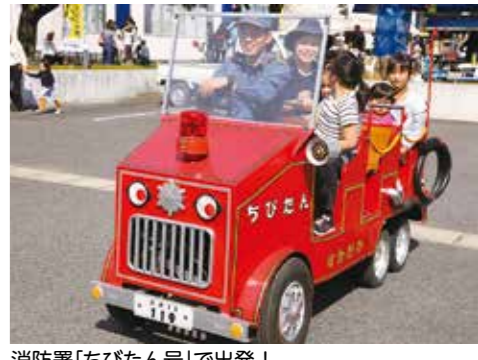
消防署「ちびたん号」で出発！

「第42回子どももの祭典」実行委員会・市明るいまちづくりの会連絡協議会(生涯学習スポーツ課内) ☎(88)91773