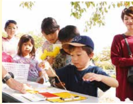
スタンプラリーにチャレンジして、景品をゲット

その他 駐車場は、須賀川アリーナの一部、文化センター、須賀川信用金庫本部をご利用