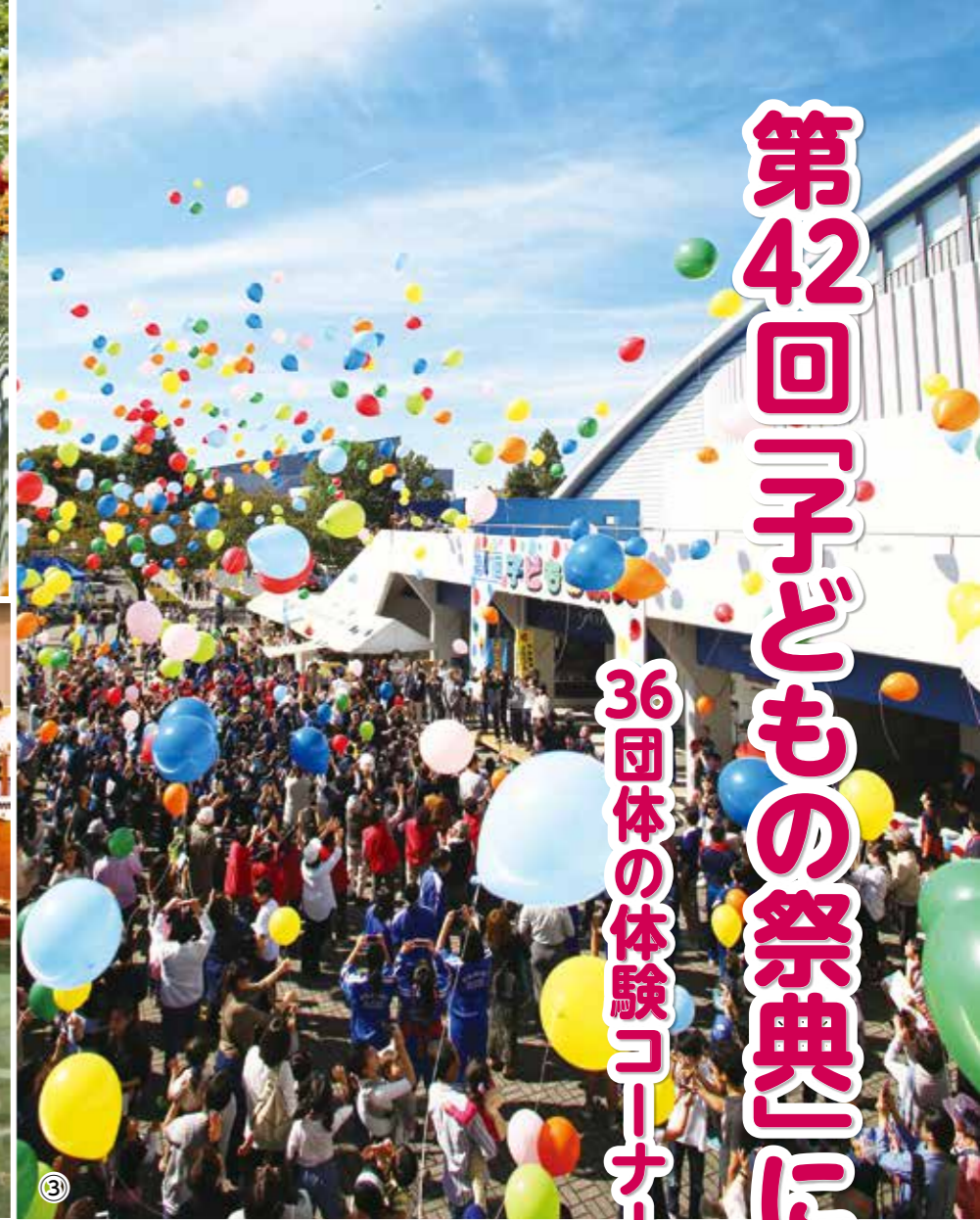
昨年の様子 ①親子でチャレンジする「モンキーブリッジ」コーナー ②松明太鼓の体験コーナー ③開会式で行われたバルーンリリース