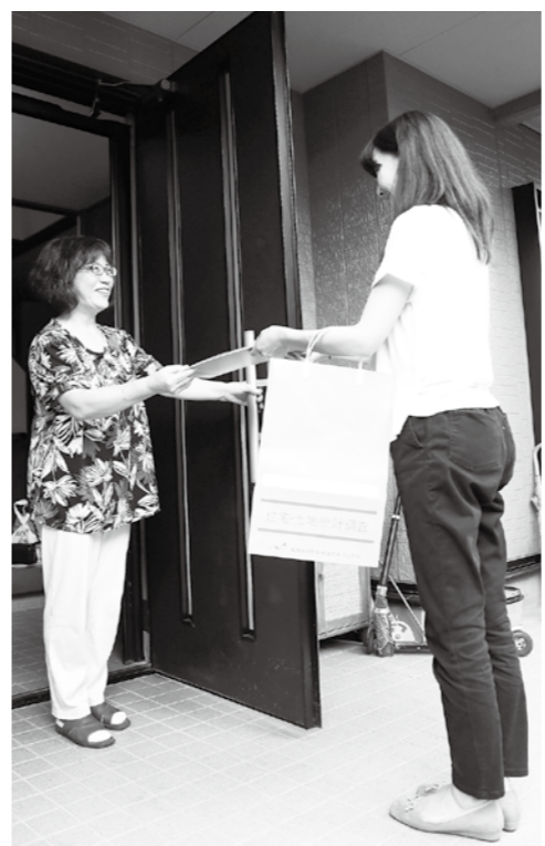
統計調査員が訪問します

10月1日現在、市内で指定された調査地域の中から、無作為に選ばれた住宅とそこに住んでいる世帯(約2700世帯)が調査対象です。※一戸建ての住宅だけでなく、アパート・マンションなどの共同住宅、工場や病院な