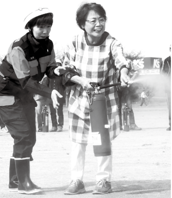
消火器を使った消火訓練

市防災訓練は、市民の防災に関する意識の向上や、地域や家庭の防災力を高めるとともに、災害時における防災関係機関の協働体制の確立を図るため、毎年実施しています。訓練は、震度6強の地震により、各所で火災の発生や土砂崩れで集落が孤立したなどの想定で行います。 日時 9月30日(日) 午前8時30分~正午(予定) 会場 大東中学校 駐車場 大東小学校校庭 内容 ●オフロードバイク隊、ドローンなどによる被害調査訓練 ●災害救助犬と自主防災組織による救助訓練 ●はしご車による建物からの救助・避難訓練 ●消防署