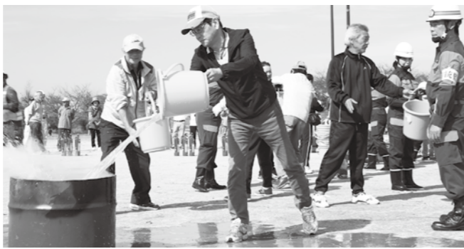
みんなで協力するバケツリレーによる消火訓練

市防災訓練は、市民の防災に関する意識の向上や、地域や家庭の防災力を高めるとともに、災害時における防災関係機関の協働体制の確立を図るため、毎年実施しています。訓練は、震度6強の地震により、各所で火災の発生や土砂崩れで集落が孤立したなどの想定で行います。 日時 9月30日(日) 午前8時30分~正午(予定) 会場 大東中学校 駐車場 大東小学校校庭 内容 ●オフロードバイク隊、ドローンなどによる被害調査訓練 ●災害救助犬と自主防災組織による救助訓練 ●はしご車による建物からの救助・避難訓練 ●消防署