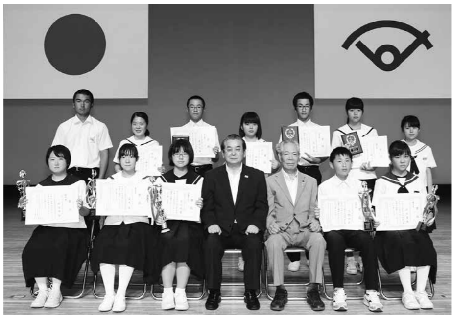
受賞した10人の皆さんと司会を務めた2人

間です。ホワイトボー ド記入の仕事も、国旗 や校旗を毎朝掲揚する 仕事も、生徒会執行部 全員で行っている朝の 挨拶運動も、後期に なったら行うことは なくなるでしょう。私 が小さなプライドを掛 けて書いたホワイト ボードの書き換えも後 期になったら終わるの です。だからこそ私 は、今行っている生徒 会のどんな仕事も手を 抜くつもりはありません 。「こんなものでいい か。」と思ってしまっ たら、私のプライドは吹 き飛んでしまいます。 だから、今私に与えら れている仕事を、私は プライドを掛けてやっ ていこうと心に誓っ ています。たかがホワイ トボードの書き換えで も、生徒会執行部を引 退するまで、私にとつ てはかけがえない大切 な役割です。 自分がやるべきこと と、任された仕事には 小さいながら確固たる プライドを持っていま す。こんな些細な仕 事でも誰かのためにな るのですから、どの仕 事も大切なものである