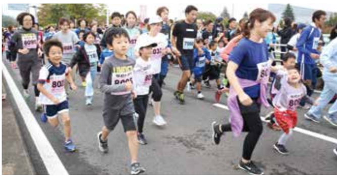
親子で楽しく走ろう(昨年の様子)

日本陸連公認大会として、 ハーフ・10キロメートルマラソンなどを開催します。 開催日 10月21日(日) 時間 午前8時50分～正午 会場 須賀川アリーナ付近 (スタート・ゴール) コース 上の図のとおり 競技種目 ▼一般男子ハーフ(年代別) ▼一般女子ハーフ ▼一般男子10キロメートル(年代別) ▼一般女子10キロメートル・5キロメートル ▼高校男子10キロメートル ▼高校女子5キロメートル ▼中学男子5キロメートル ▼中学女子3キロメートル ▼小学男子・女子(4年生以上)2キロメートル ▼親子(父と子・母と子)1・4キロメートル