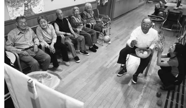
レクリエーションを楽しむいわせデイサービスの利用者