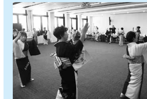
神奈川県座間市との交流(民謡)

市では、イメージアップ戦略として「都市間交流補助事業」を行っています。 対象者 ▼市内に事業所がある事業者、NPO法人 ▼10人以上の市民で組織する社会教育関係団体 ▼公益上、市長が特別に認める団体など 対象事業 友好交流都市(神奈川県座間市や北海道長沼町など)の団体との、相互交流を目的とした都市間交流事業 ※県や市のほかの補助金を受けているときは対象外 対象経費 交流事業に要する旅費や会場費など ※人件費、食糧費、資産を形成するための経費などは対象外 補助率 対象経費の2分の1(千円未満切り捨て)とし、10万円を上限 申請期間 予算の上限に達するまで 申請方法 次の書類を観光交流課に提出してください。 ●交付申請書 ●事業計画書 ●収支予算書 ●参加者名簿 ●そのほか参考となる資料 申請書類などは、観光交流課や各公民館にあります。また、市ホームページからもダウンロードできます。 その他 交流事業を実施するに当たり、団体などの紹介も行いますので、お気軽にご相談ください。 観光交流課 ☎(88)9145