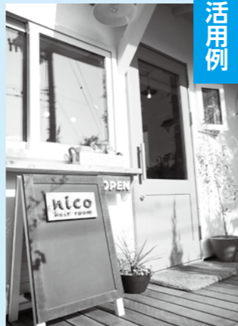
おしゃれな玄関がお出迎え

市創業相談窓口や創業支援補助金、創業等支援補助金制度を利用して、昨年10月、かしわぎニュータウン内にヘアサロン「nico hair room」をオープンしました。