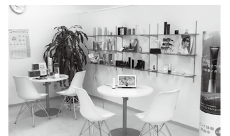
白を基調にした明るい店内