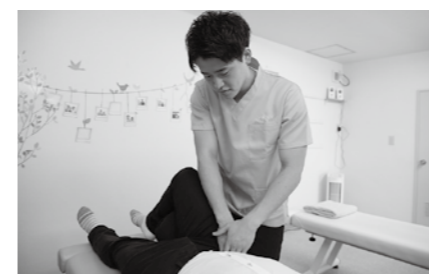
大好評の「おなかの整体」