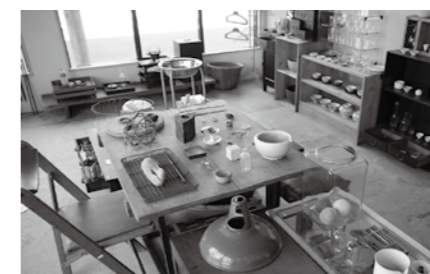
おしゃれなアンティーク雑貨が並びます