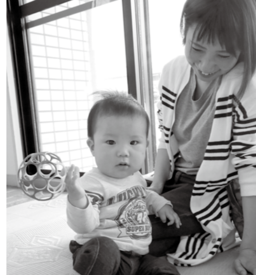
すくすく育ちます(5月11日・乳幼児健診)