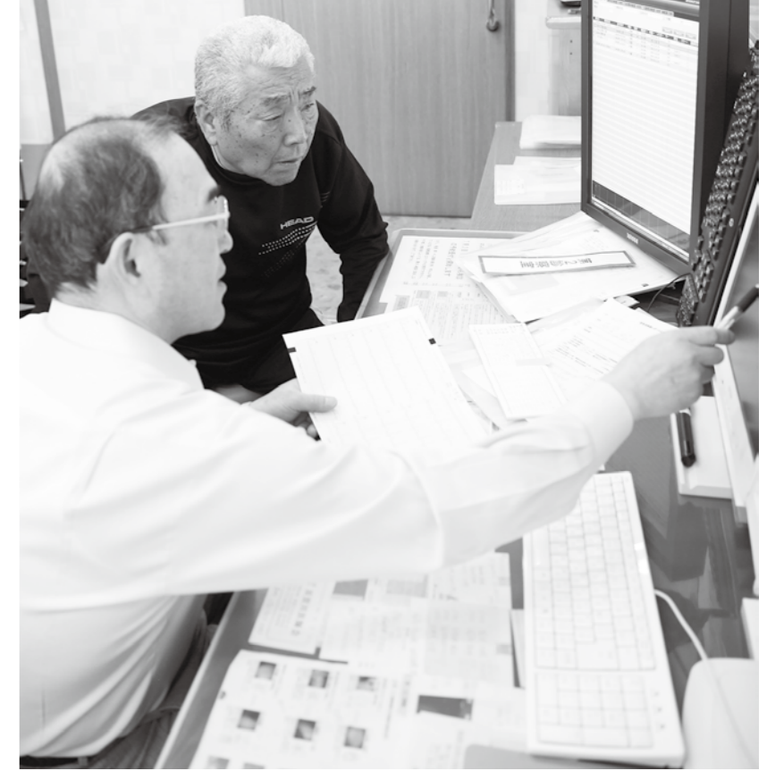
医師による診察の様子

健康診査は、生活習慣を見直し、自ら生活を改善することで、心臓病や脳卒中などの病気を未然に防ぐために実施しています。定期的な受診で、自分自身の健康状態を把握しましょう。