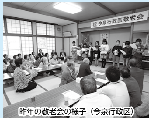
昨年の敬老会の様子 (今泉行政区)