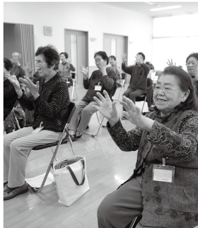
運動器機能向上事業 (4月19日・長沼保健センター)