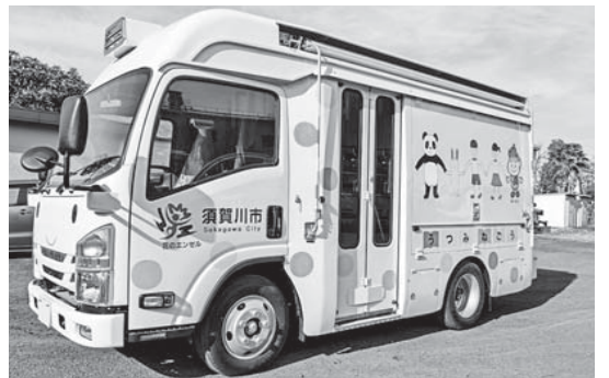
新しくなったうつつみね号

の表のとおりです。 車体のデザインには 願いを込めて うつつみね号の車体に描かれた絵は、うつつみね号を通じてより多くの皆さんが読書に親しみを持てるようデザインしました。 ポーターと子どもたちが手をつなぐ絵は、小さな図書館