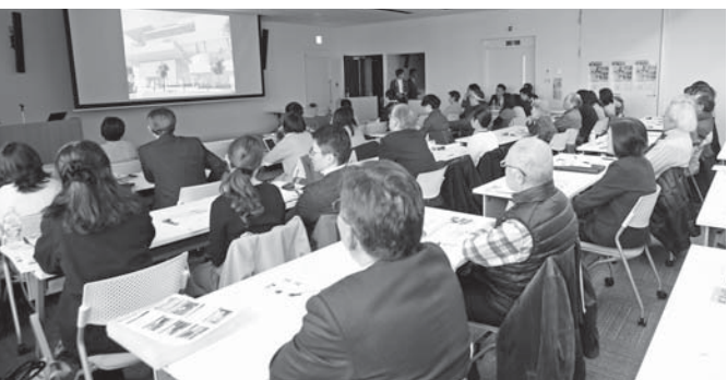
tetteの可能性やつながる図書館についてみんなで考えました

市長のお話を聞いて大変勉強になりました。関心のない人たちへ地道に興味・関心を持ってもらいたいのので、勉強会やイベントにはできるだけ参加したいです。(40代女性) ▼ワクワクしました。完成が一層楽しみになりました。自分も利用したいし、多くの市民の人にtetteを活用してほしいです。(50代女性) ▼図書館に対するイメージが変わりました。図書館を作るのは我々市民一人一人であることを初めて知りました。(70代男性)