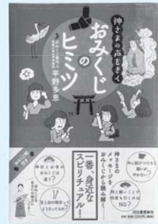
一般図書 『神さまの声をさくおみくじのヒミツ』 平野 多恵/著