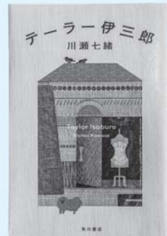
一般図書 『テーラー伊三郎』 川瀬 七緒/著