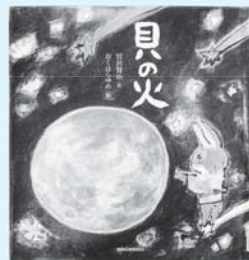
児童図書 『貝の火』 宮沢 賢治/作 おくはら ゆめ/絵