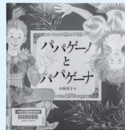
児童図書 『パパゲノとパバゲーナ』 小西 英子/作