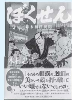
一般図書 『ほくせん 一幕末相撲異聞』 木村 忠啓/著