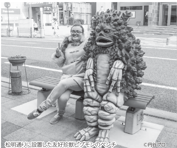
松明通りに設置した友好珍獣ピグモンのベンチ ©円谷プロ