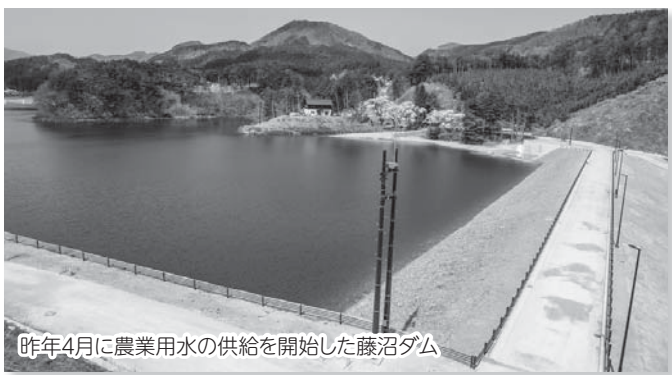
昨年4月に農業用水の供給を開始した藤沼ダム