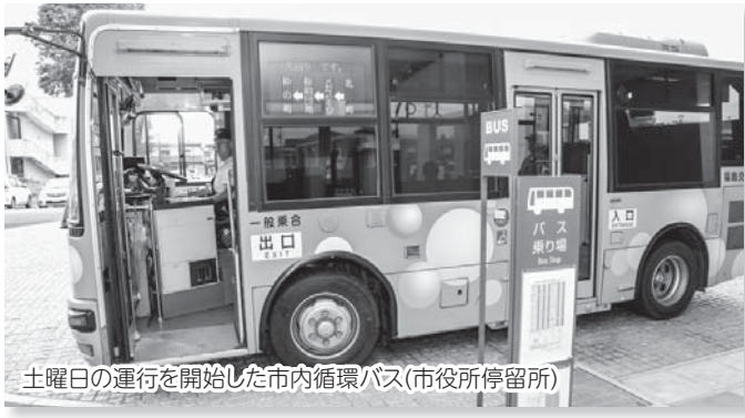
土曜日の運行を開始した市内循環バス(市役所停留所)