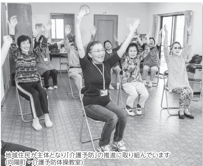
地域住民が主体となり「介護予防」の推進に取り組んでいます(向陽町・介護予防体操教室)

市内9か所での地域懇談会や岩瀬管内5校での高校生の須賀川創生ミーティングを行い、市の将来に対する多くの声を踏まえ、第8次総合計画須賀川市まちづくりビジョン「2018」を昨年12月に策定しました。4月から、各施策に取り組んでいきます。