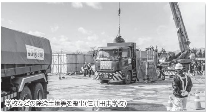
学校などの除染土壌等を搬出(仁井田中学校)