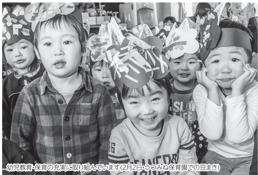
幼児教育・保育の充実に取り組んでいます(2月2日・うつみね保育園での豆まき)