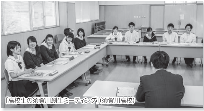
「高校生の須賀川創生ミーティング」(須賀川高校)