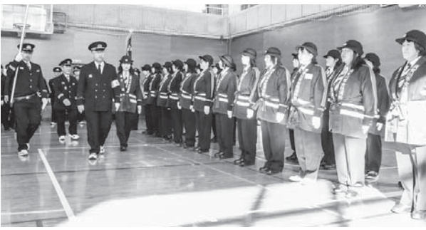
春は火災の多い季節です。火の用心をお願いします(1月4日・市消防団出初式)