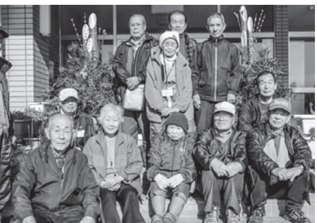
申告の準備はお早めに(平成29年12月16日・西袋地域歳時記で、中学生にしめ縄作りの指導に当たった老人クラブの皆さん)

※原則、野焼きは禁止されています。害虫駆除のため野焼きをするときは、農政課 ☎(88)9140にご相談ください。消防署への届け出も忘れずにお願います。