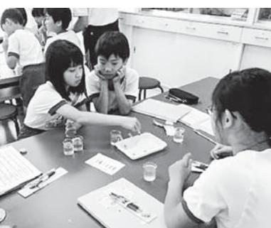
水質検査などで下水道の大切さを学びます(6月15日・大森小)

合併処理浄化槽は、下水道や農業集落排水の処理施設と同様に優れた浄化機能を有していますが、その機能を発揮させるには、定期的な保守点検と年1回以上のくみ取り清掃、法定検査が大切です。悪臭や