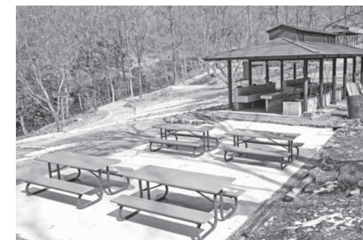
炊事棟の隣には新しいテーブルとベンチも