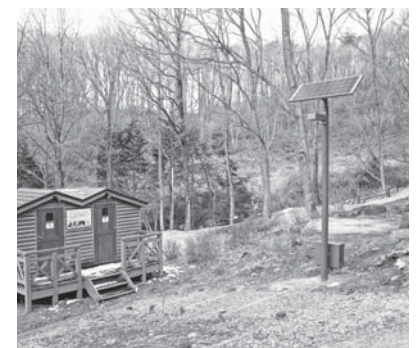
再生可能エネルギーを利用するソーラー外灯