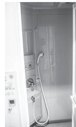
管理棟内のシャワー室