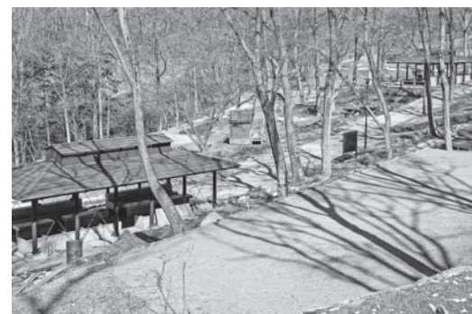
キャンプサイトが広くなりました