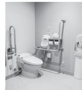
管理棟内の多目的トイレ