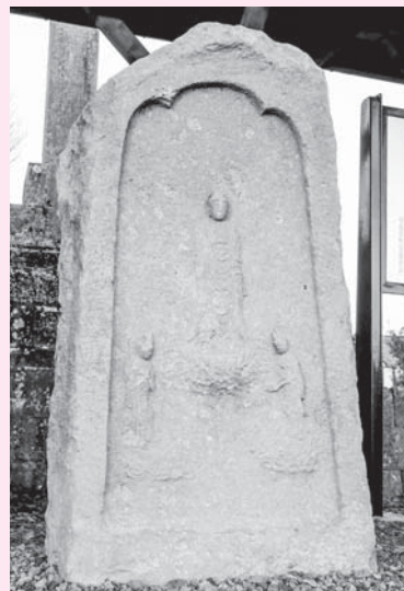
石造阿弥陀三尊来迎供養塔(市内畑田)

現在、市内や郡山市を中心に100基を超える三尊来迎供養塔が確認されています。当地域における中世の信仰の深い資料と言えます。