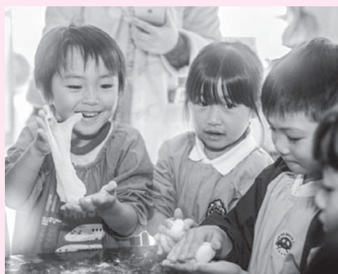
上手に丸められるかな?