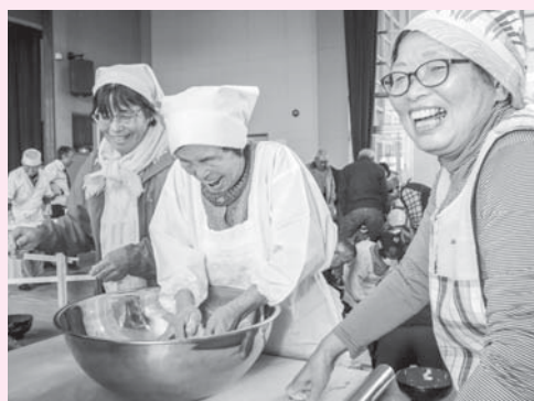
かくし味にみんなの笑顔が入っています

講師の長沼ナタネ・ソバ生産組合員による講義と実演の後、各クラブに分かれてそば打ちを体験。打ち立てゆで立ての新そばを味わいながら、交流を深めていました。