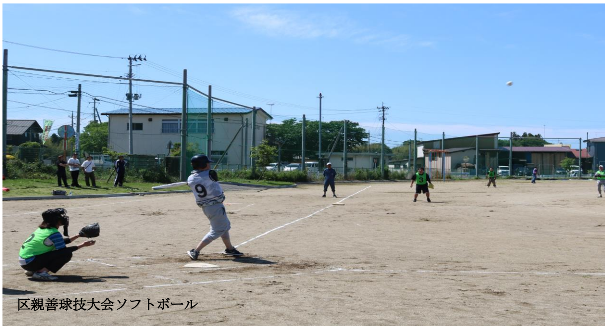
区親善球技大会ソフトボール

6月4日(日)に稲田学園グラウンド及び稲田地域体育館で、4年ぶりに区親善球技大会を開催しました。