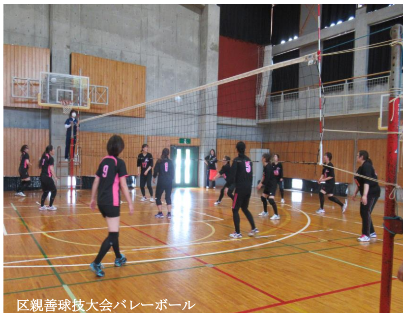
区親善球技大会バレーボール