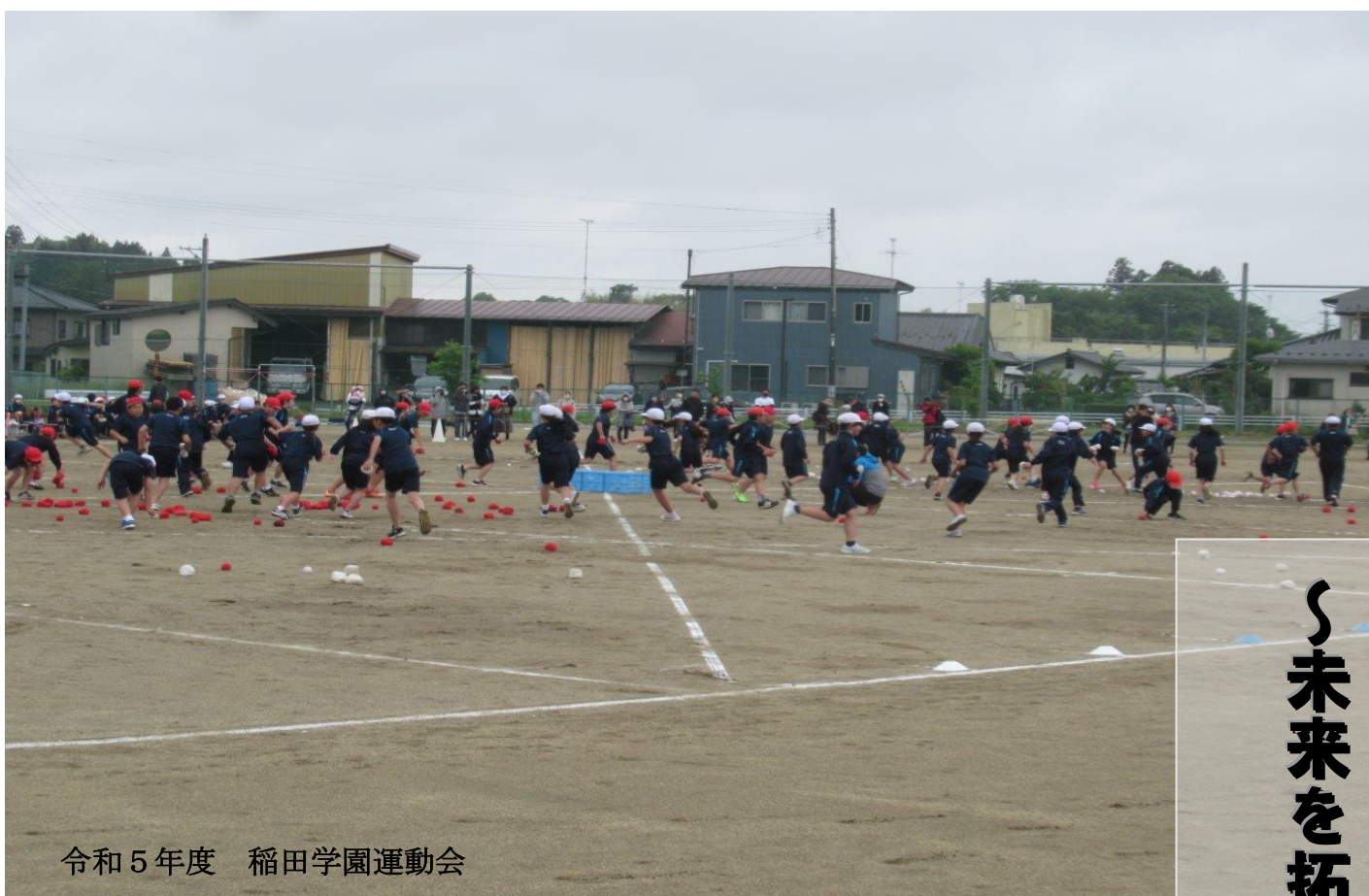
令和5年度 稲田学園運動会

〒962-0043 須賀川市岩渕字岡谷地 32 番地 1 TEL 0248-92-2003 FAX 0248-92-2004 E-mail inada@city.sukagawa.fukushima.jp