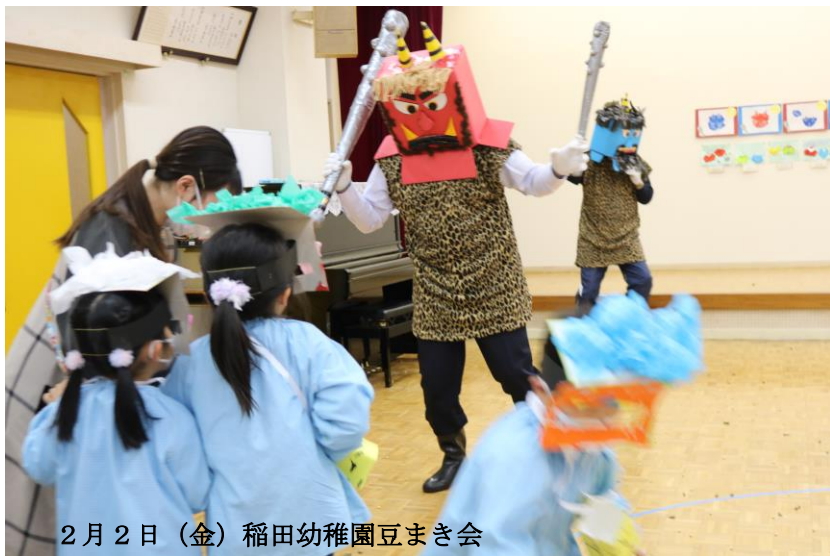
2月2日(金) 稲田幼稚園豆まき会