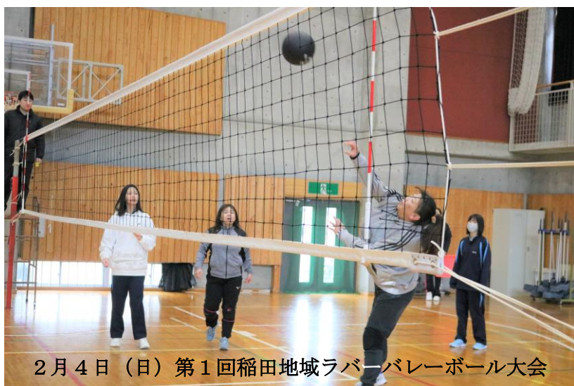
2月4日（日）第1回稲田地域ラバーバレーボール大会

〒962-0043 須賀川市岩渕字岡谷地 32 番地 1 TEL 0248-92-2003 FAX 0248-92-2004 E-mail inada@city.sukagawa.fukushima.jp