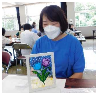
ディンプルアート作品

今年も開講しました！ 第1回は、車廃材から生まれた絵の具で描く、今大注目の「ディンプルアート」に挑戦しました。ステンドグラスのように美しくきらめく作品に、皆さん大満足でした。次回はお楽しみ移動研修です♪