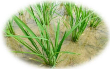
← 田んぼの苗も30cmほどに、成長してきました！