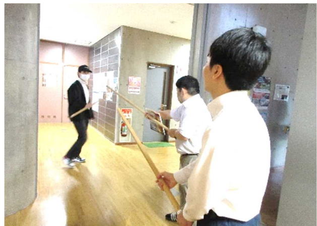
← コミュニティセンター職員も訓練に協力しました！ (不審者役で)