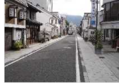
景観形成を促す石畳舗装整備