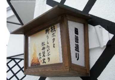
風流を創出する軒行灯の設置