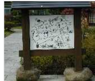
地域案内看板整備