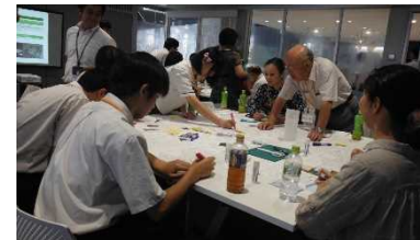
文化交流拠点整備(ワークショップ風景)