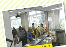
コミュニティプラザで光の町住民票発行も!