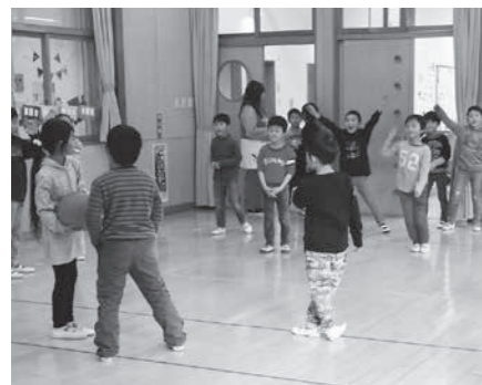
館内には元気な声が響いています

利用希望者の増加に対応するため、増築工事を行っています。現在の利用定員は125人ですが、4月からは、約200人になる予定です。