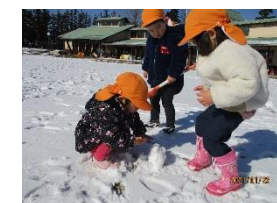
雪遊びだーい好き