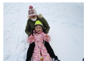
先生とそりすべり