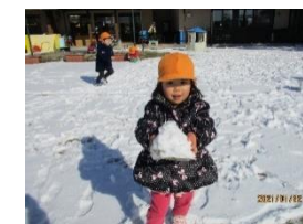
たくさん雪集めたよ