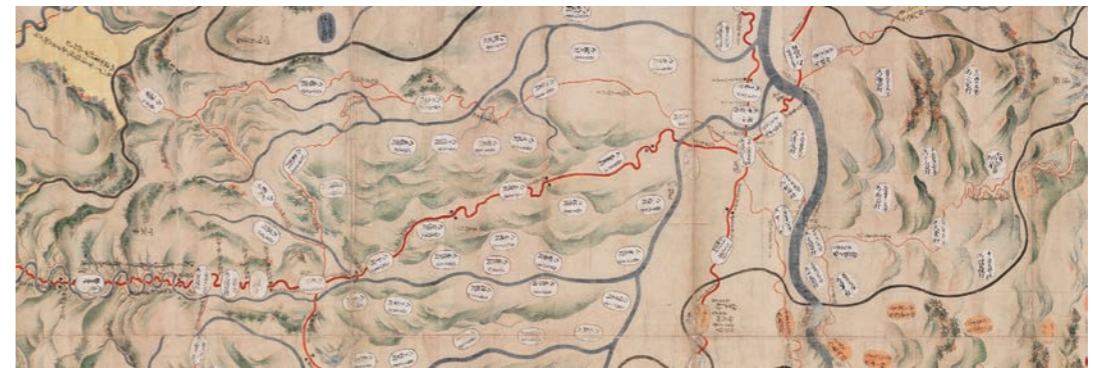
江戸時代の須賀川の村々 (六郡絵図・部分)