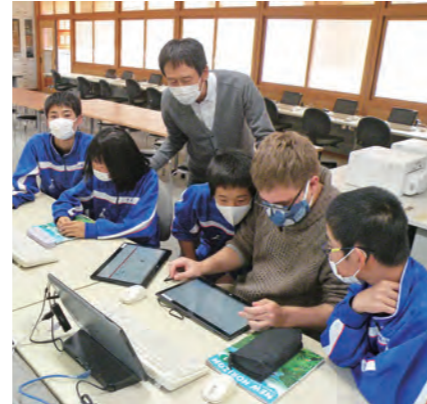
授業の幅を広げるタブレットなどの活用