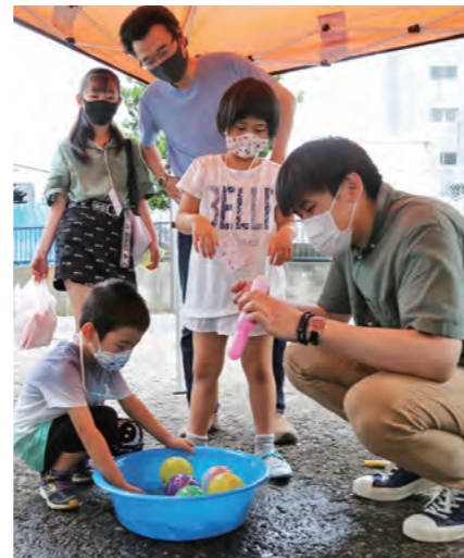
子どもたちに人気のkokoyoriハウスの緑日