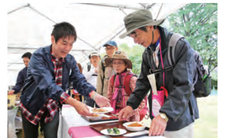
ONSEN・ガストロノミーウォーキングで地域の「味」を再発見