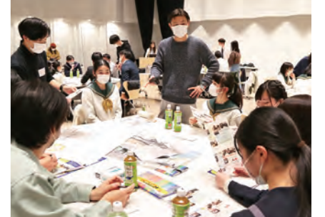
駅西地区の「まちづくりワークショップ」