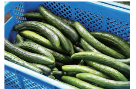
全国的にも有名な須賀川産のきゅうり