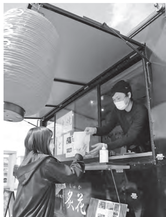
感染症対策と社会経済活動の両立が大切です