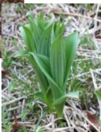
芽出し期 のコバイ ケイソウ