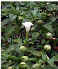
チョウセン アサガオの葉と花