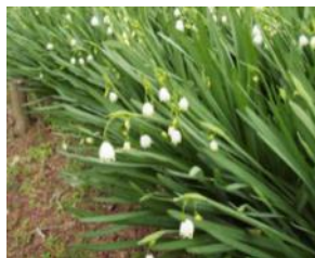
(スノーフレーク) (スズランスイセン)