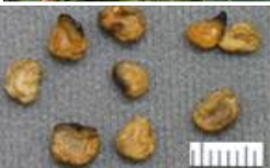
チョウセン アサガオの種