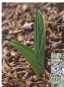
芽出し期の バイケイ ソウ