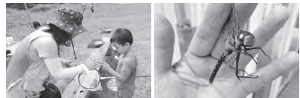
どんな虫がいるかな~?