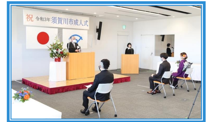
令和3年須賀川市成人式の様子