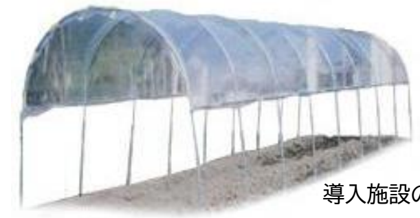
導入施設のイメージ