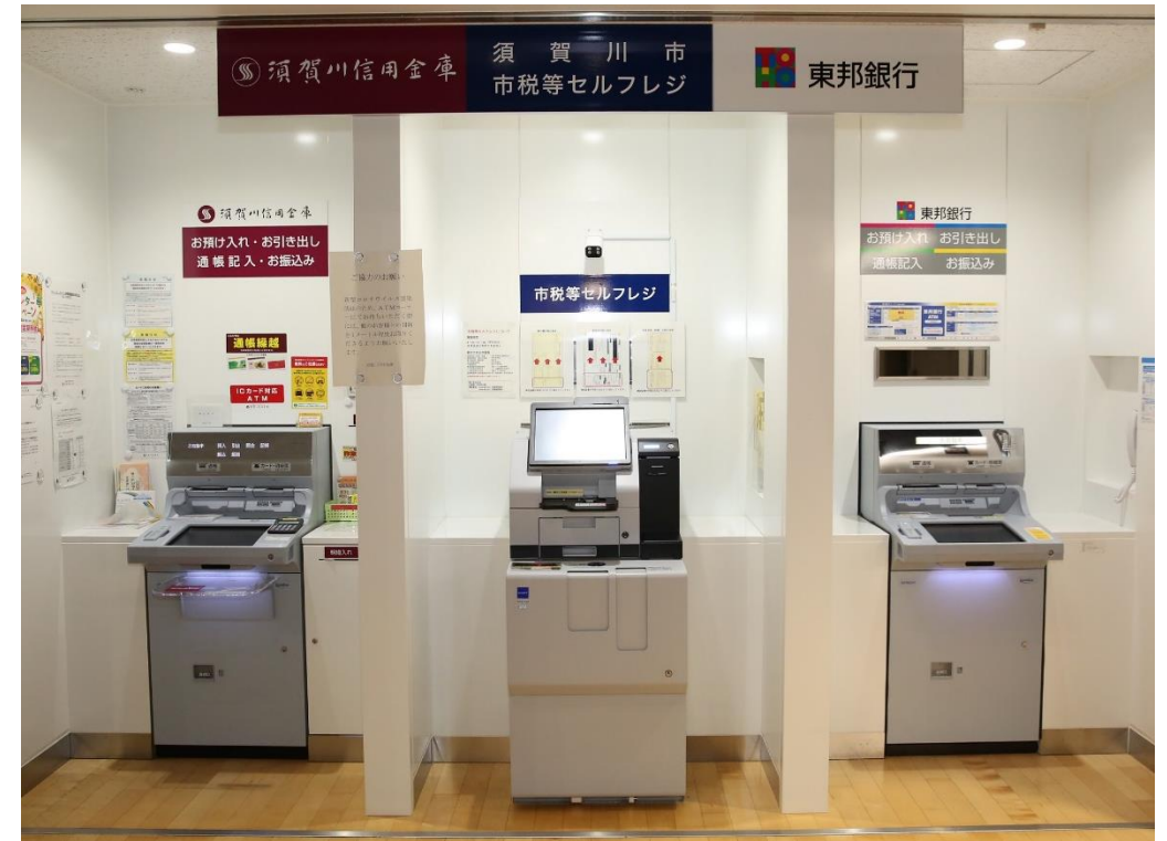
非対面での納付が可能です(中央がセルフレジ)