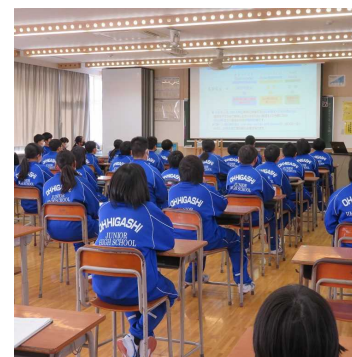
出前講座(大東中 R4.1月)