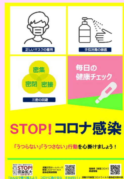
市コロナ感染予防啓発ポスター

自分自身と大切な人を守るため、「うつらない」「うつさない」行動を心がけるよう、お願いいたします。