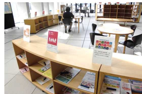
SDGsアイコンの掲示(みんなのスクエア)