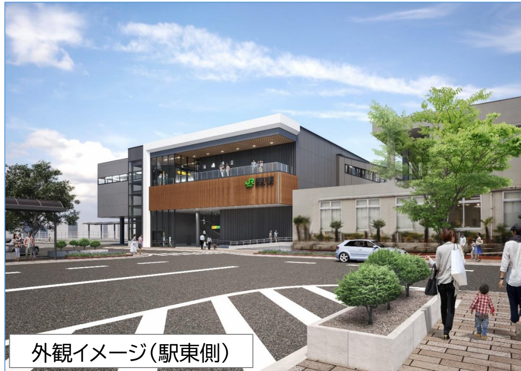
外観イメージ(駅東側)