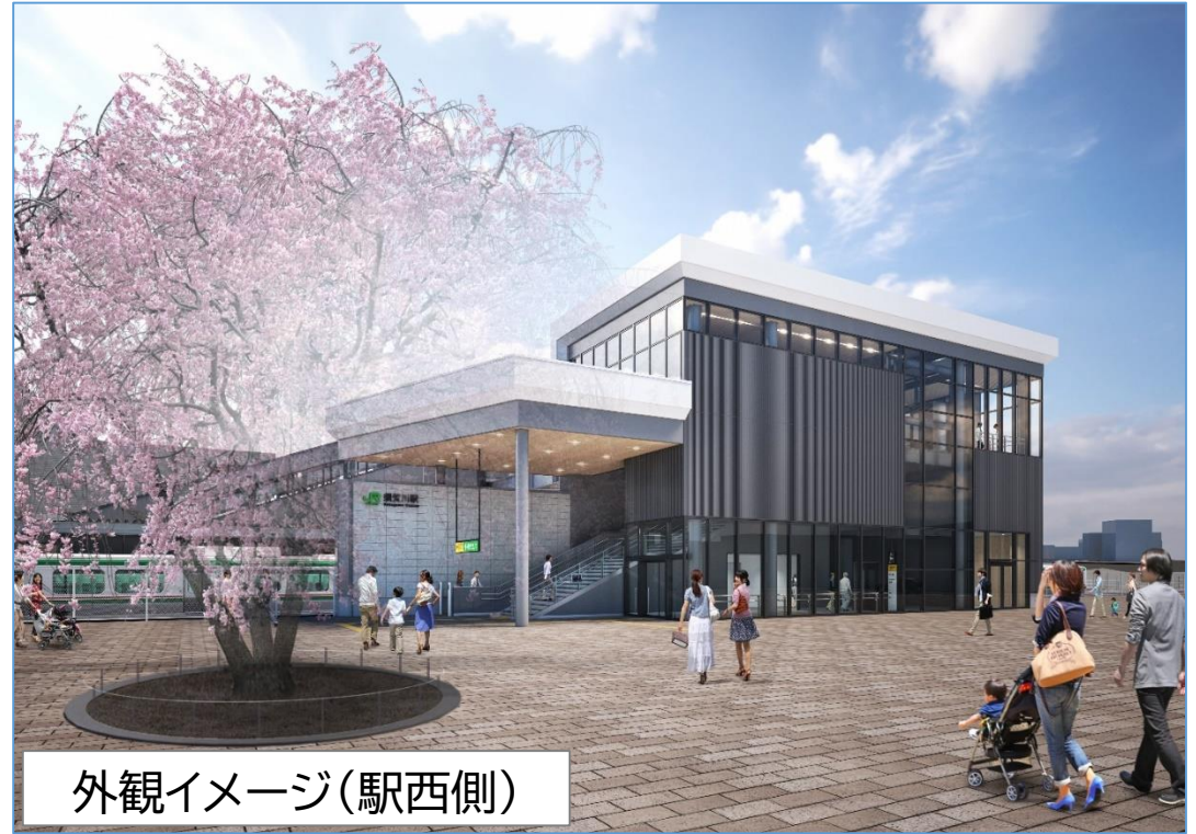
外観イメージ(駅西側)