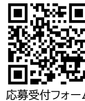
応募受付フォーム