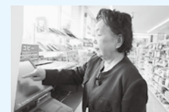
手軽に証明書が取れます

市役所まで行かなくても、近所のコンビニで証明書が取れるので便利です。皆さんもカードを作って便利さを味わってください。