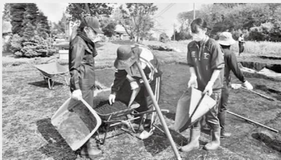
笹山原遺跡で活動する「発掘ガール」

発掘ガールたちの実習中の様子に迫りつつ、約20年におよぶ発掘成果展「発掘ガール展」を開催します。これまで県内各地で巡回展を行ってきましたが、本月初開催です。開催期間 7月1日(金)〜9月9日(金)