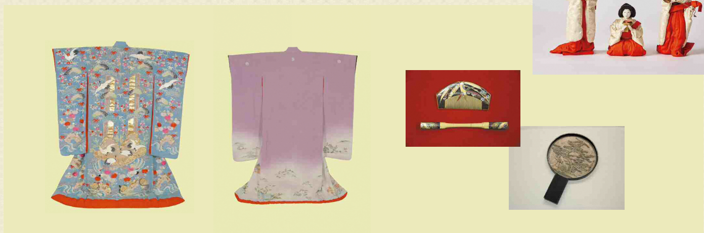
「三人官女（段飾り雛）」大正時代 「色打掛・引振袖」昭和時代 「蒔絵袴・箆」明治時代 「柄籠（銘・天下第一木村若狭守）」江戸時代 ※全て当館蔵

今年は女性を彩った「装い」をテーマに御人形や装束などを展示します。時代を問わない、愛らしさと美しさを感じていただければ幸いです。