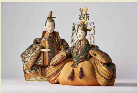
「享保雛」江戸時代後期 当館蔵

当館では、昭和45年の開館以来毎年、主に市民の皆さんから寄贈された雛人形により「雛人形展」を開催しています。奥州道を通じた江戸との交流によりこの地にもたらされた、たくさんの御人形は、一足早い須賀川の春の風物詩です。