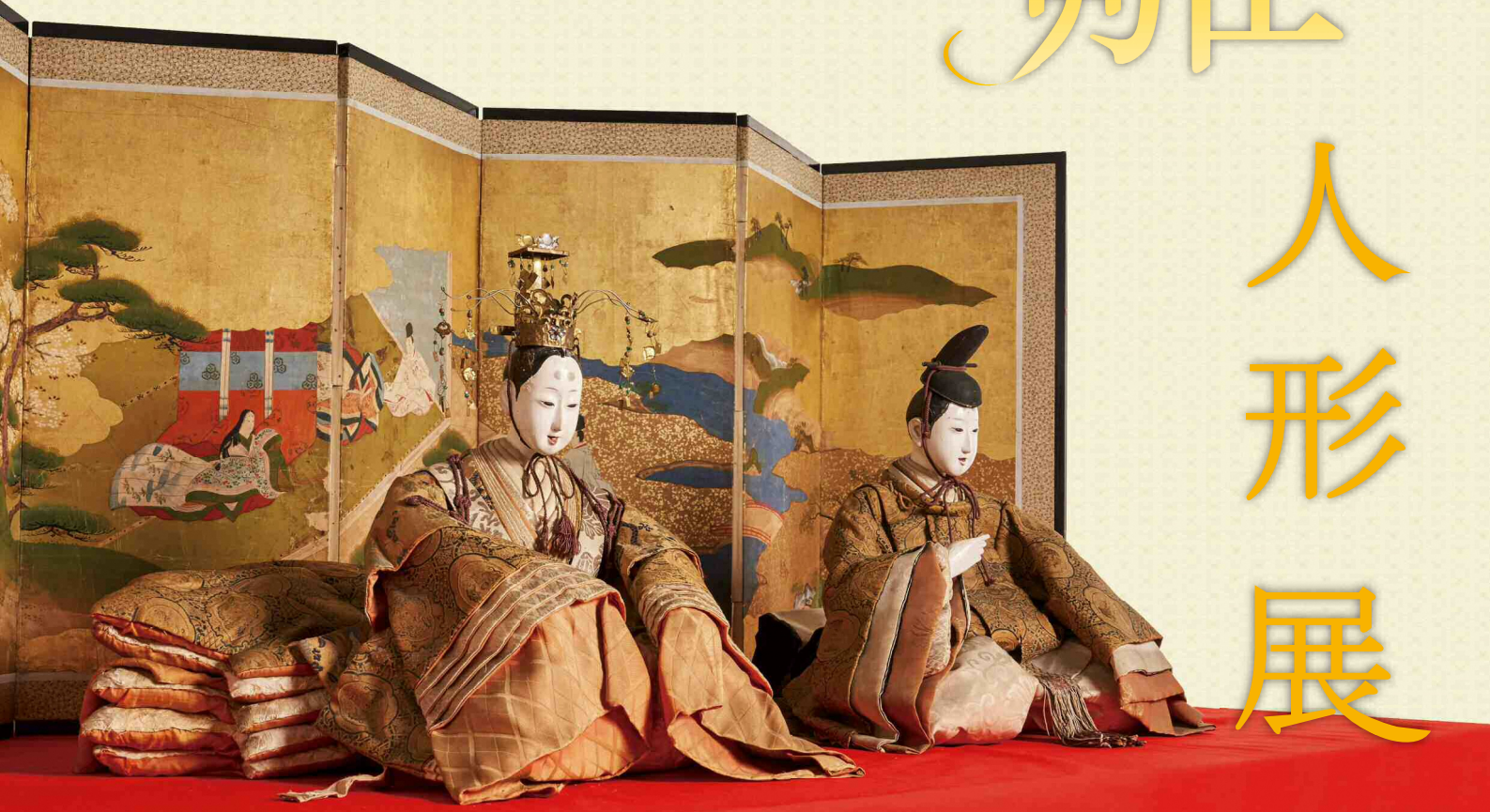
「古今雛」江戸時代後期 当館蔵