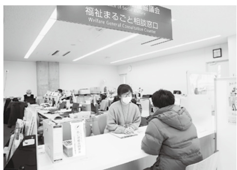
相談員が、問題解決に向け包括的に支援します