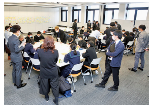
みんな10年後を想像した中学生ワークショップ

新たな試みとして中学生ワークショップと市民ワークショップを開催しました。中学生ワークショップでは「10年後のわたしとこのまち」をテーマに、中学生の視点から想像する「すかがわ近未来カレンダー」を作りました。市民ワークショップでは、須賀川の「ひと・まち」をテーマに、魅力や地域資源の再発見などを通して「すかがわストーリー/マップ」や「すかがわ近未来カレンダー」を作りました。 そのほか、市内9カ所での地域懇談会や市民アンケート、パブリックコメントなどで市民の皆さんから意見をいただき計画を策定しました。