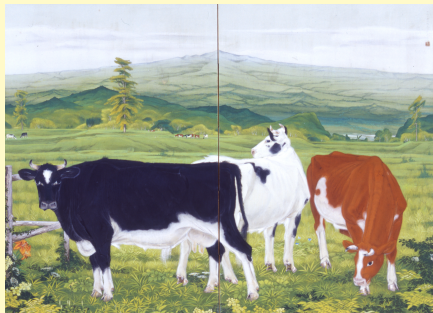
「高原」須田珉中 絹本着色 二曲一隻

本展では、須賀川ゆかりの作家の作品を中心に、様々な方法で表現された花鳥風月の美しさをご覧ください。