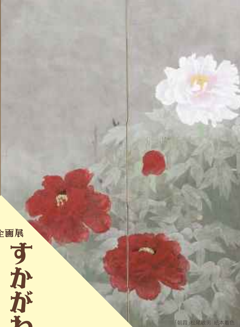
「朝霞」松尾敏男 紙本着色