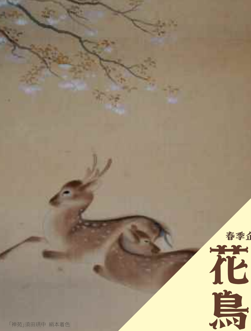
「神苑」須田珉中 絹本着色