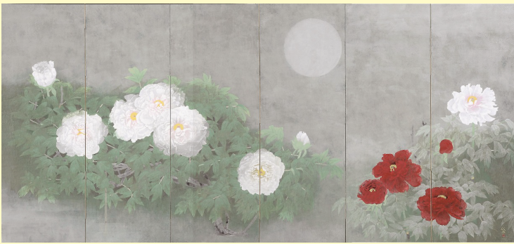
「朝霞」松尾敏男 紙本着色 六曲一隻

四季の自然と生き物が織り成す美・花鳥風月は、いつの時代も、芸術家の創作意欲の源です。