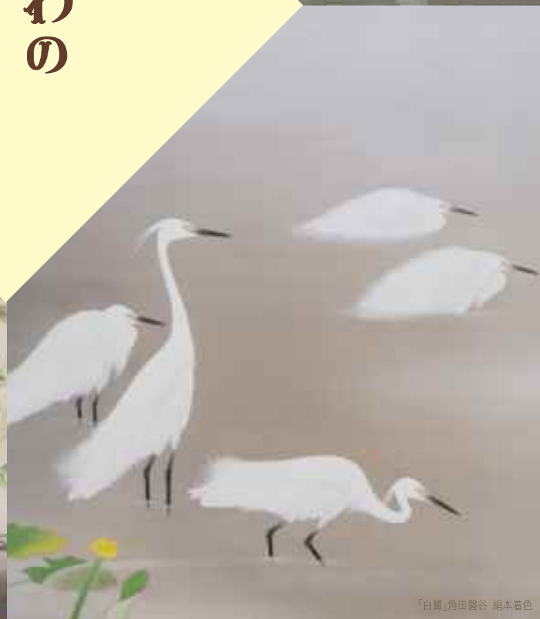
「白鷺」角田馨谷 絹本着色