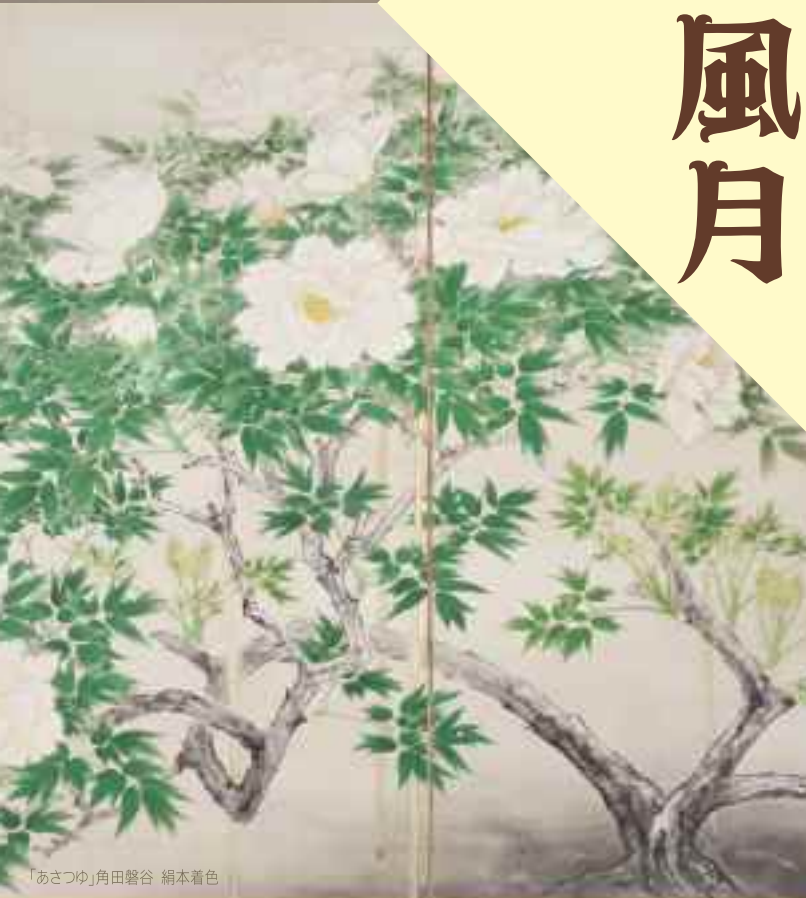
「あさつゆ」角田馨谷 絹本着色