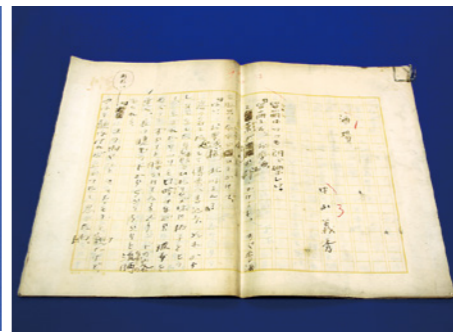
「酒場」直筆原稿(当館蔵)