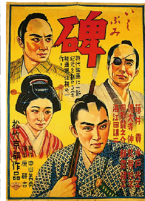
映画「碑」ポスター(こおりやま文学の森資料館蔵)